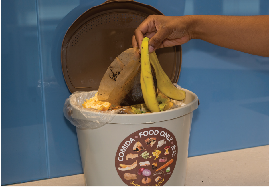
在準備餐點、咖啡或茶之後。