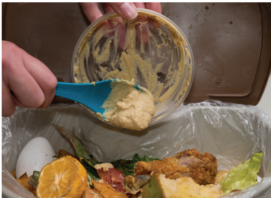
當你清理冰箱的時候。